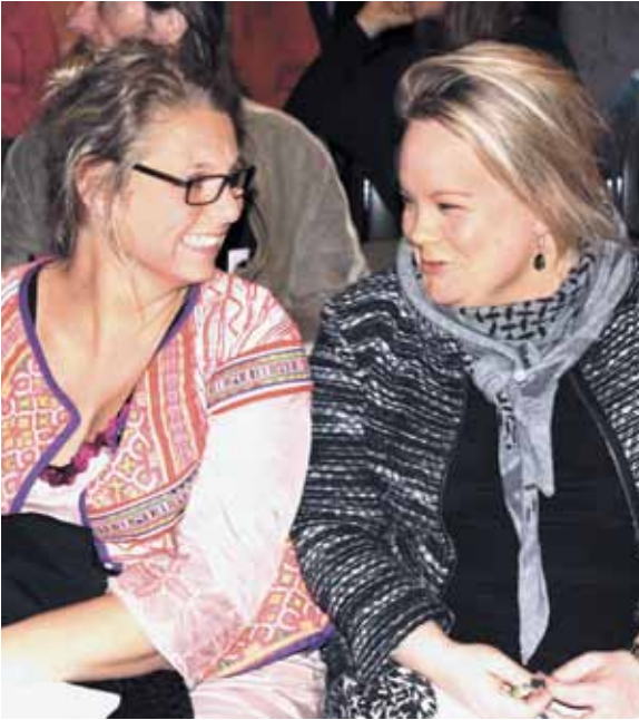
Mon jeg vinder i lodtrækningen?