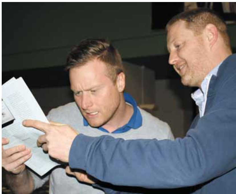
Hvad står der dog?