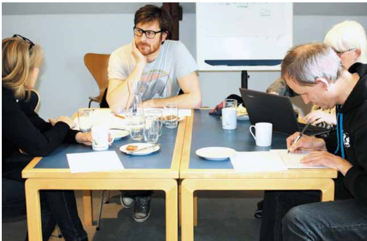
L 409 debatteres på kredskontoret

Vi vil arbejde for, at lærerne, på trods af nyt ledelsesrum, lovgivning og stive rammer for arbejdet, kan fastholde den værdifulde fleksibilitet i opgaveløsningen, der giver lærerne mulighed for at levere størst mulig kvalitet i arbejdet. Men alle former for fleksibilitet i forhold til lærernes arbejdstid skal, så længe der ikke er en arbejdstidsaftale, ske på en måde, så det er muligt for den enkelte lærer at få opgjort den del af arbejdsopgaverne, der ikke løses på skolen. Det skal sikres, at lederen i den løbende dialog med hver eneste lærer forholder sig til den samlede arbejdsopgave, så lærerne ikke udsættes for modstridende eller uklare krav i arbejdet eller at arbejdsopgaverne ikke kan defineres og afgrænses. Flere ledere melder i ramme alvor ud, at arbejdet som tillidsrepræsentant fremad bliver meget lettere. Selvovervurderingen vil ingen ende tage. Det er bemærkelsesværdigt, hvor ringe følelse der allerede nu er med den tilstand, arbejdsmiljøet mange steder