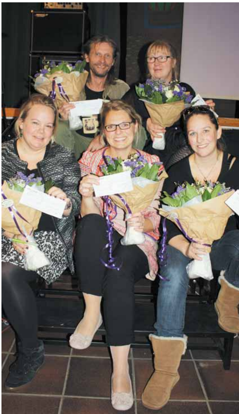
Vinderne af rejselegater

Med disse ord overgiver jeg beretningen, den skriftlige og den mundtlige, til generalforsamlingens konstruktive drøftelse. ■