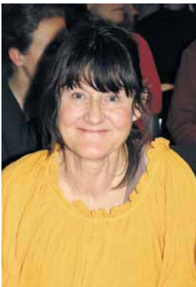
Der er altid plads til et smil !

Efter et år i skyggen af konflikten har også de små medlemsgrupper understreget vigtigheden af, at de er et lige så vigtigt fokuspunkt for såvel Danmarks Lærerforening centralt som for os lokalt. Det er naturligvis også de små medlemsgrupper, der sammen med lærerne og børnehaveklasselederne i folkeskolen udgør den samlede forening. Det drejer om konsulenter, psykologer og alle vores regionalt ansatte medlemmer og medlemmerne på CIS. Det er blandt andet i erfaringer fra disse