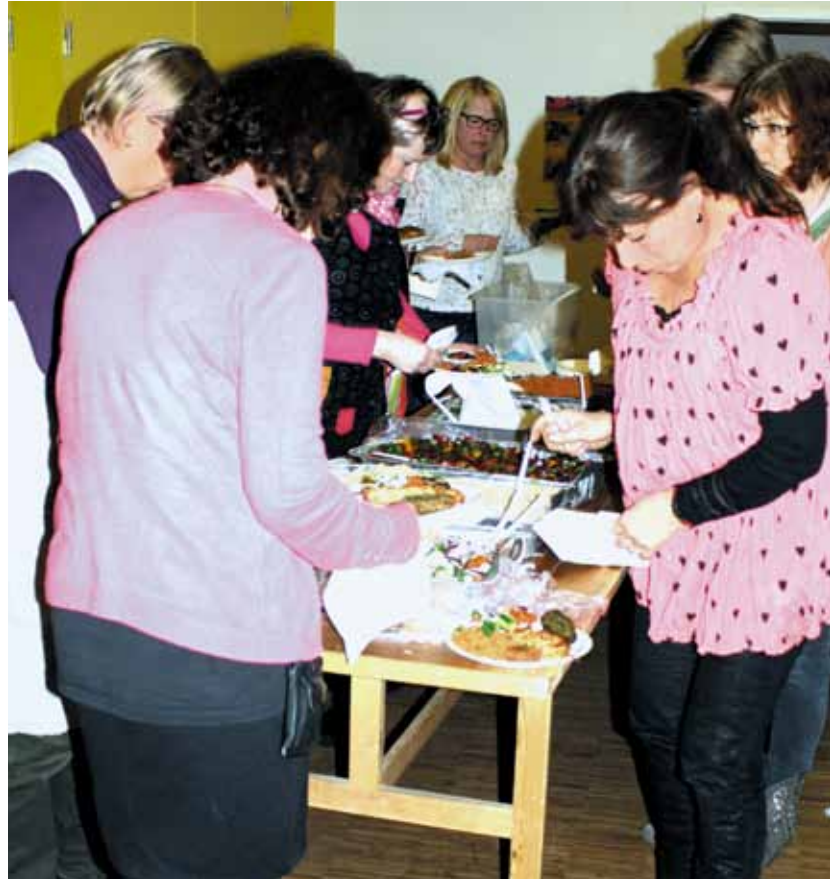
Og efter mødet er der fællesspisning

medlemsgrupper, at vi kan se og forstå udfordringerne ved at få en ny dagligdag til at være meningsgivende, når arbejdsvilkårene ændrer sig markant.