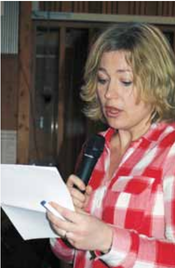
En resolution læses op