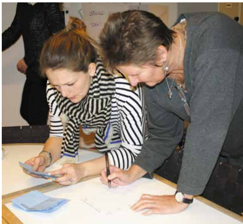
Stemmetællerne noterer resultaterne

Men hvor ville det dog være dejligt, hvis Gentofte Kommune, ligesom flere andre kommuner, var interesserede i og turde at gøre status over arbejdet med inklusion. Vi skal fortsat sætte inklusion på dagsordenen, når vi mødes med forvaltningen, skolelederne, TR og AMR, for at sikre, at inklusion ikke bliver den enkelte lærers problem. Vi skal holde politikerne fast på deres ansvar for at sikre rammerne, så børn med særlige behov kan få den nødvendige hjælp, så larm og uro i klasserne kan begrænses.