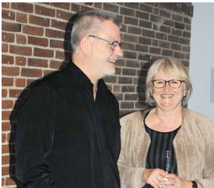
Et godt grin med GKs kasserer

2014, så er bekymringerne, frustrationerne og det dårlige arbejdsmiljø forsvundet? Vi kommer til at indskærpe over for ledelsen, hvilke vilkår