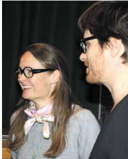
En resolution drøftes med medlemmerne

de nødvendige rammer og ej heller det tilstrækkelige antal lærere til en vellykket inklusion.