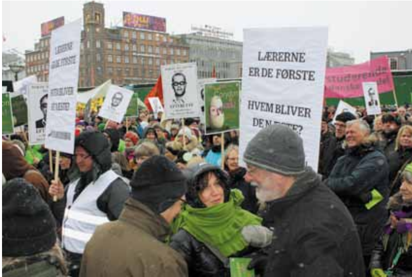
Demonstration ved Christiansborg

Vi skal kæmpe for at fastholde en folkeskole, der forbereder til et samfund, der bygger på frihed og folkestyre, og hvor skolens virke er præget af åndsfrihed, ligeværd og demokrati, som det stadig hedder i formålsparagraffen. Lige nu står vi over for en skolereform, der peger i den stik modsatte retning. Der er høj risiko for, at undervisningen rettes mod "teaching to the test". Det eneste mål er at tilvejebringe fine ranglisteplaceringer med det formål er at skabe lydige, omstillingsparate og konkurrencedygtige ansatte til fremtidens arbejdsmarked.