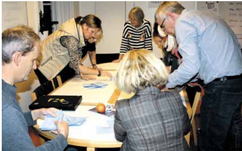
Stemmetællerne arbejder på højtryk

Kommunens konklusioner står i skærende kontrast til Gentofte Kommunelærerforenings inklusionsundersøgelser, der peger på, at lærerne ikke har den nødvendige specialpædagogiske viden og kompetence til at varetage undervisningen af de inkluderede elever. Omstillingspuljen på et tocifret millionbeløb er indtil videre ikke i nævneværdig grad blevet brugt til at imødekomme dette behov. Endvidere er der på skolerne ikke