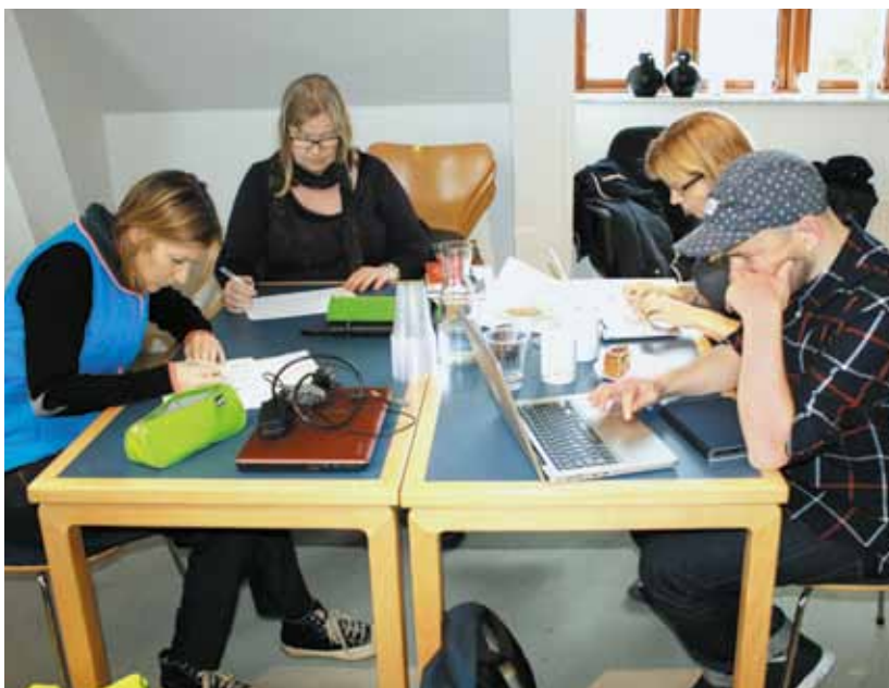
TR'erne arbejder med L 409

fra kriterier om lærernes forskellige erfaringer og vurderinger af undervisningsopgavens sværhedsgrad. Det er en ekstrem kompleksitet, der ligger i denne problemstilling. Det er fuldstændigt urealistisk at forestille sig, at skolelederen kan forholde sig til den enkeltes situation i detaljen for at tildele den enkelte lærer den rette forberedelsestid. Derfor hører vi også om flere ledere, der er forsøger at give afkald på den del af forpligtelsen ved at give opgaven videre til teamet. Det skal understreges, at det er og bliver skoleledelsens pligt at planlægge arbejdstiden, så den samlede arbejdsopgave kan løses inden for den planlagte arbejdstid – det er ikke teamets eller den enkelte lærers opgave. Vi vil have fokus på, at lærerne sikres den nødvendige forberedelse, selvom undervisningstiden øges, og at rammerne for undervisningen gør det muligt at gennemføre den på et kvalificeret niveau på trods af inklusion og andre opgaver, der presser sig på.