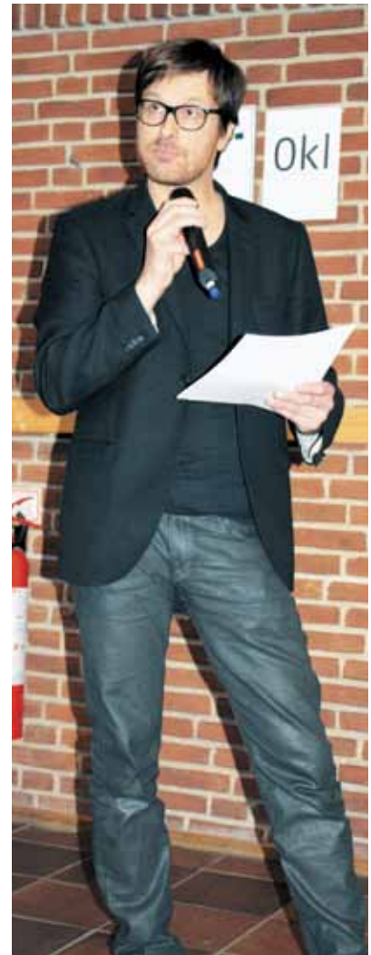
Jeppe aflægger mundtlig beretning

Vi står over for nogle af de største udfordringer nogensinde, hvor vi som forening skal fastholde den styrke og det helt enestående sammenhold og den opbakning, som vi havde før, under og efter arbejdsgivernes lock-out, hvor de og regeringen forgæves forsøgte at sætte en kile ned mellem medlemmerne og foreningen. Til deres store frustration måtte de konstatere, at det ikke var muligt af den simple grund, at medlemmerne er Danmarks Lærereforening. Vi er parate til at investere engagement, kreativitet og hjerteblod for vores fælles sag – det er helt enestående i ordet egentlige betydning.