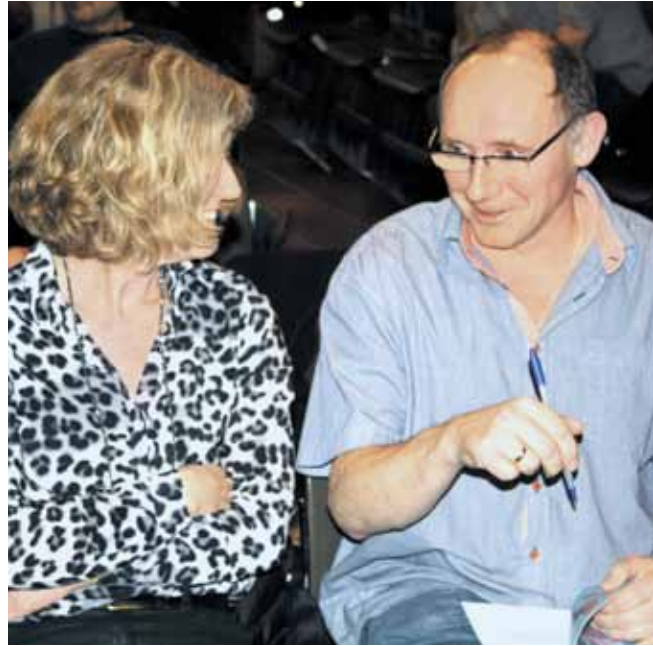
Er det her, jeg skal sætte mit X ?

når nogle helt forståeligt var ved at give op. Tusind tak for det.